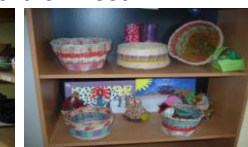
pletení z pedigu