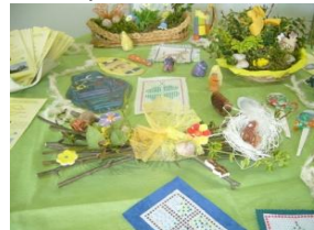
pedig a aranžování

Zájmové kroužky: vaření, hudební (zpěv, tanec), sportovní (cyklistika, plavání, atletika, míčové hry, bobování, turistika)