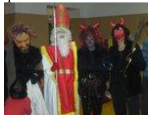
Čert a Mikuláš

Volnočasové aktivity: vycházky, výlety, cestování, cestování veřejnou dopravou, návštěvy kulturních a sportovních zařízení, rehabilitační a poznávací pobyty, nakupování, společenské akce.